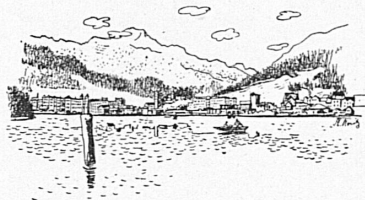
St. Moritz-Bad Zeichnung von F. Krumenacher