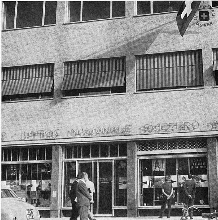
In alto: La facciata dell'edificio con le vetrine dell'agenzia dell'Ufficio centrale svizzero del turismo.

Oben: Die Fassade des neuen, von Architekt Armin Meili erbauten Gebäudes, mit den Schaufenstern der Agentur der SZV.