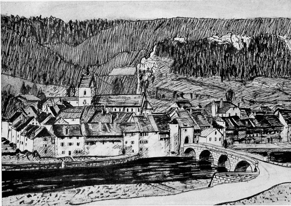
Oben: Blick auf das Städtchen St. Ursanne am Doubs. Zeichnung von Albert Schnyder.