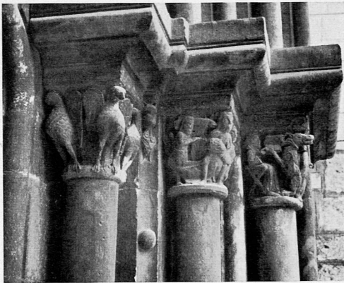
Oben: Romanische Kapitäle am Südportal der Stiftskirche. Ci-dessus: Chapiteaux romans du portail sud de la Collégiale de St-Ursanne.

Gewiß befindet sich der Reisende, der von Grenchen oder Basel her ins Delsberger Becken einfährt, schon hier in welschem Gebiet, im Jura bernois. Wenn er aber, ein Teilstück der Linie Bern-Paris benützend, beim Dörfchen Montmelon aus dem Tunnel kommt, ist er bereits tief in romanische Lande gelangt, fließen doch die Wasser des tief unter ihm liegenden