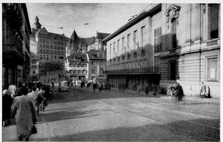
Oben, von links nach rechts: Der untere Steinenberg mit dem Casino vor 100 Jahren und heute. Ci-dessus: Le Casino situé au Steinenberg, en 1850 et aujourd'hui.