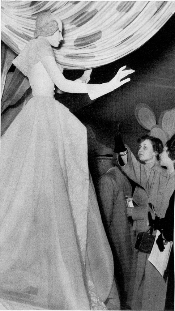
↑ Oben: St.-Galler Stickerei im Modepavillon. Ci-dessus: Enchantement féminin dans le «Salon de la création» de la Foire suisse d'échantillons. In alto: Ricami di San Gallo nel padiglione della Moda.