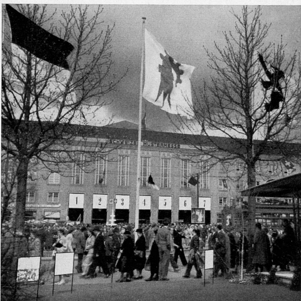
A destra: Una delegazione del Pakistan ammira i prodotti dell'orologeria svizzera. In basso: L'imponente facciata dell'edificio principale della Fiera campionaria di Basilea.