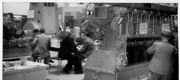
↑ Oben: Die Schwerindustrie ist durch Firmen von Weltruf vertreten. Ci-dessus: La grosse construction mécanique est représentée par des maisons de réputation mondiale. In alto: L'industria pesante è rappresentata da marche di fama mondiale