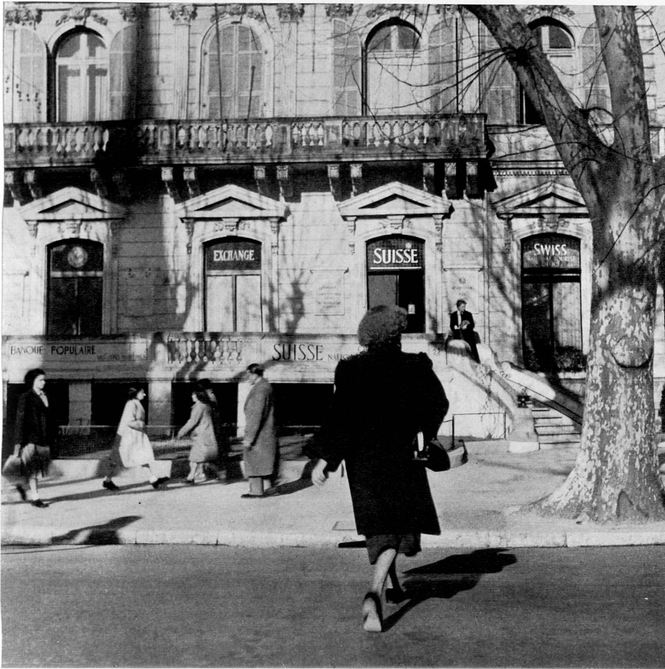
Ci-dessous: C'est à l'élégant boulevard Victor-Hugo, tout empreint du style du Second Empire, que se trouve l'Office suisse du tourisme à Nice.