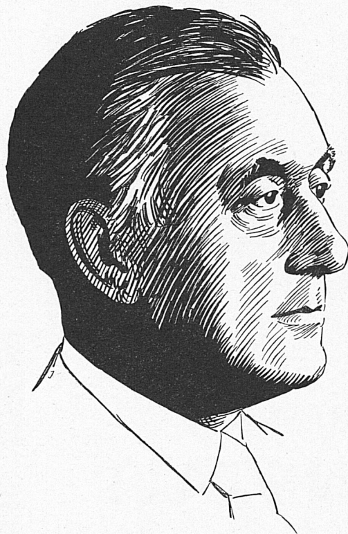
Zeichnung von E. Joller