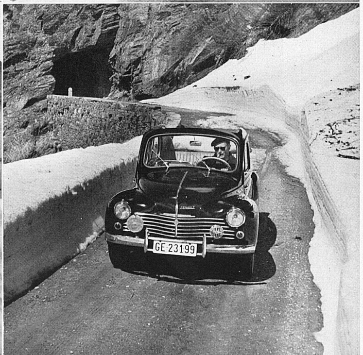
Ci-dessus: Devant l'Hospice du Simplon, non loin du sommet du col.