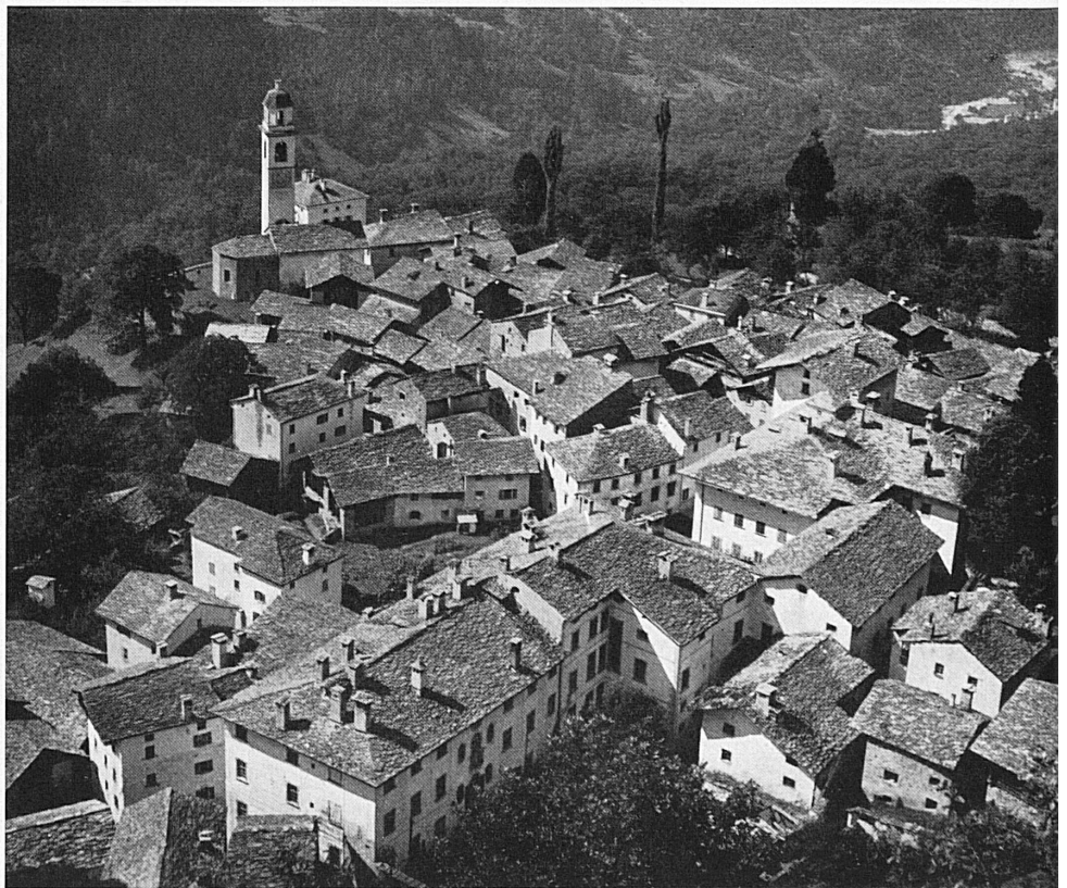
Oben: Soglio, der auf einer Terrasse sitzende, schon ganz südlich anmutende reizvolle Bergeller Flecken.

A gauche: En gare de St-Moritz, les cars postaux attendent les touristes qui se rendront à la Maloja et dans le val Bregaglia.