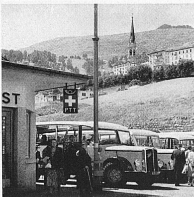
Links: Am Bahnhof von St. Moritz erwarten die Postautos ihre Fahrgäste zur Reise nach der Maloja und ins Bergell.

A gauche: En gare de St-Moritz, les cars postaux attendent les touristes qui se rendront à la Maloja et dans le val Bregaglia.