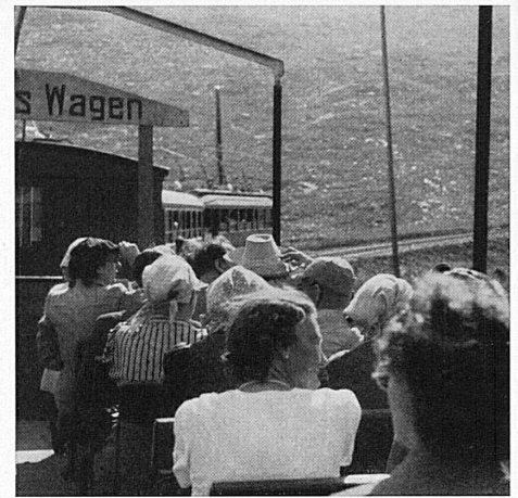
Oben: Die das Engadin mit dem Puschlav verbindende Berninabahn, deren Aussichtswagen freien Ausblick nach allen Seiten gestatten, führt beim Morteratschgletscher, auf der Berninapasshöhe und auf Alp Grüm an herrlichen Punkten vorbei.

Ci-dessus: Soglio, petit hameau bien exposé du val Bregaglia possède un charme déjà tout méridional.