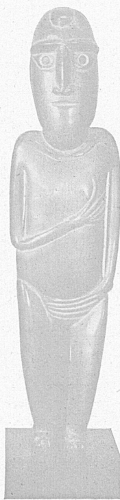
Toromiro, Ahnenftgur (Osterinsel)

Die Berner Kunsthalle zeigt vom 12. Juli bis 24. August in ihrem Zyklus «Die Kunst außer-