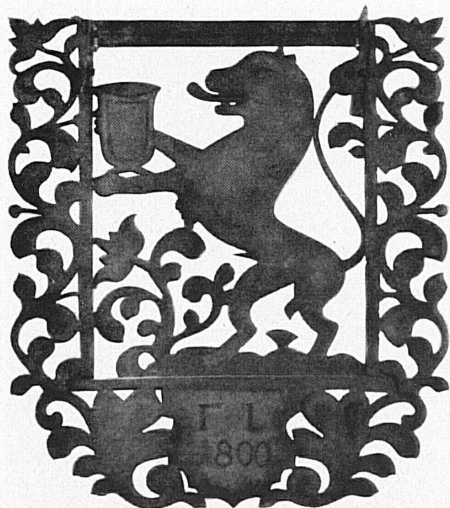
Glarner Wirtshauschild heute im Museum des Landes Glarus, Näfels Enseigne d'auberge glaronnaise conservée au Musée cantonal glaronnais, à Näfels

L'aigle et le lys témoignent des puissances qui jouèrent tour à tour un rôle prépondérant dans l'histoire; au «Major Davel», l'Ours des Bernois a trouvé son adversaire. Winkelried et Tell rappellent la lutte pour la liberté de l'ancienne Confédération. Des grappes de raisins, des ceps, symbolisent la culture de la vigne, tandis que des bottes, une ancre, évoquent les corporations. L'enseigne d'une auberge de Nyon rappelle le sort du grand peintre Courbet. Réfugié politique sans argent, il dut, pour payer son écot, exécuter l'enseigne d'une auberge des bords du Léman.