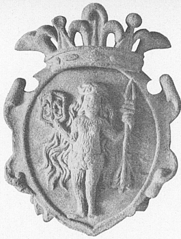
Links: Wappen des Caspar Freuler über dem Portal der Sala terrena. – A gauche: Armoiries de Caspar Freuler sur la porte de la Sala terrena. Rechts: Gestalt der Gerechtigkeit im stukkaturenreichen Gewölbe der Sala terrena. – A droite: Figure de la Justice dans la voûte richement revêtue de stucs de la Sala terrena.

Wir weisen hier auf den reich ausgestatteten Führer «Der Freuler-Palast in Näfels» von Hans Leuzinger hin, erschienen im Verlag Tschudi in Glarus.