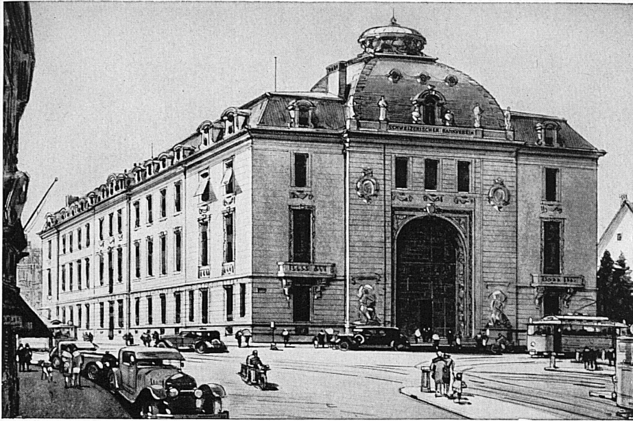
Bankgebäude in Zürich - Hôtel de la banque à Zurich