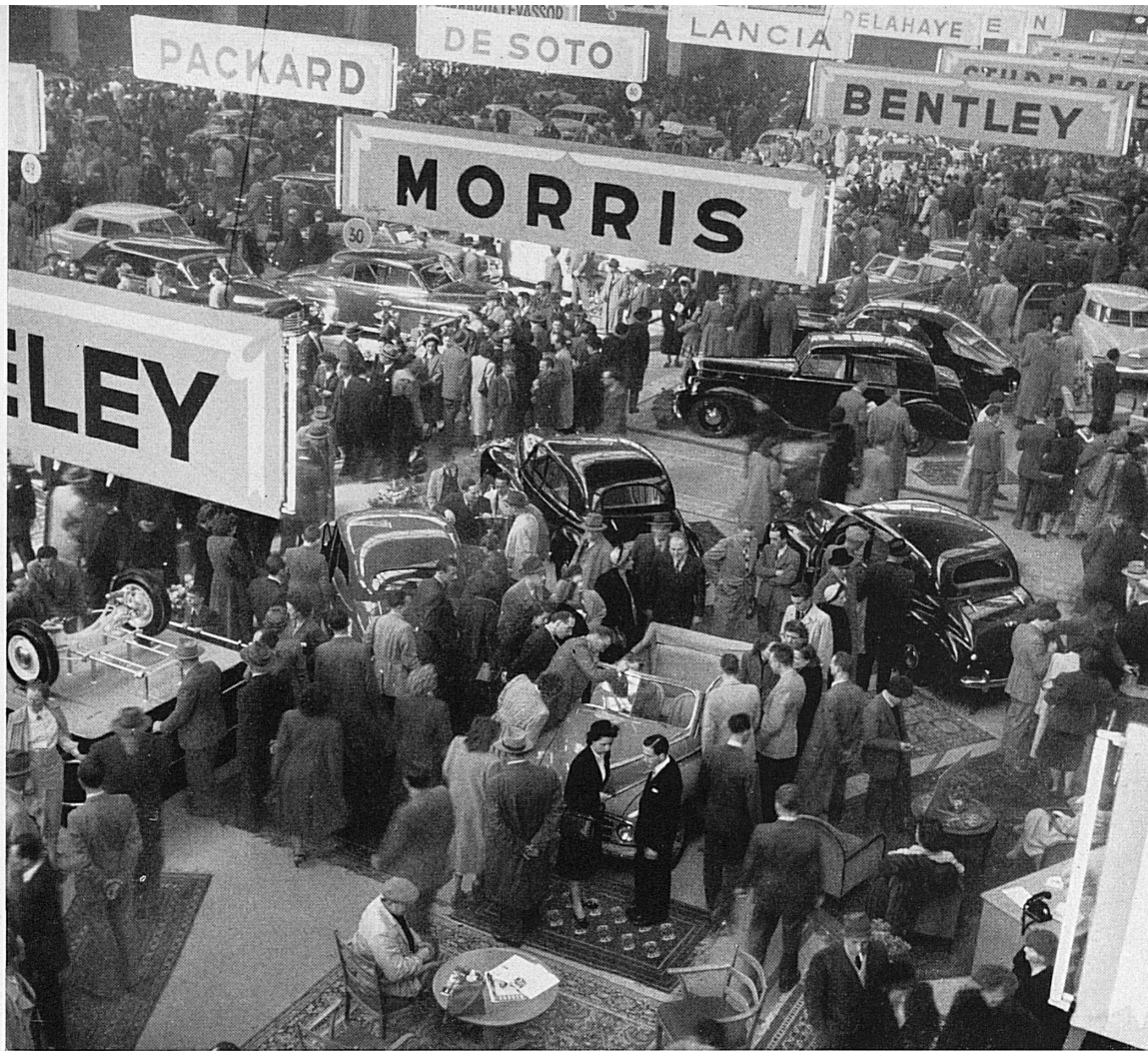
A gauche: Vue de la grande halle du Salon de l'auto à Genève.