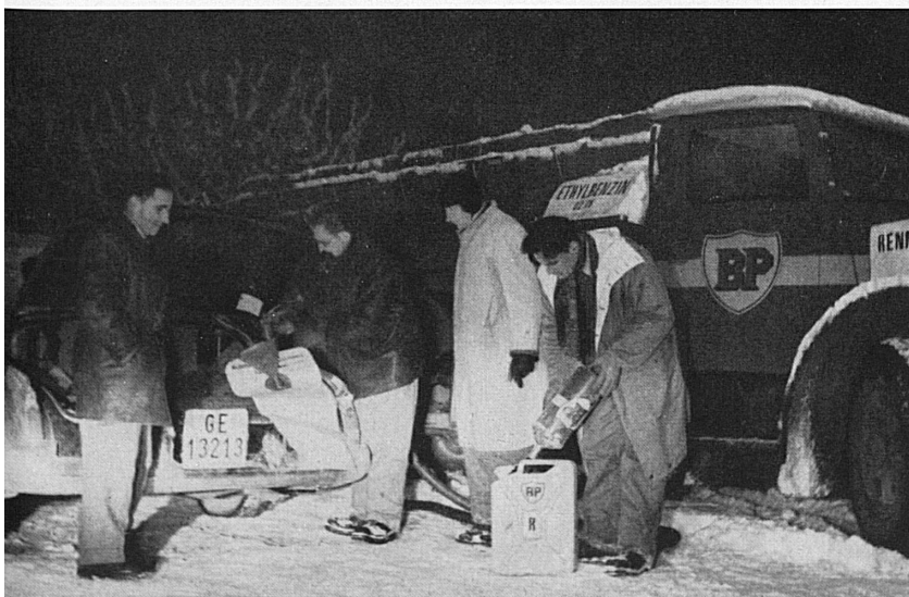
Unten: Schnappschüsse von der letztjährigen Schneesternfahrt. Von links nach rechts: Beim nächtlichen Benzin-Tanken; Ankunft am Ziel.