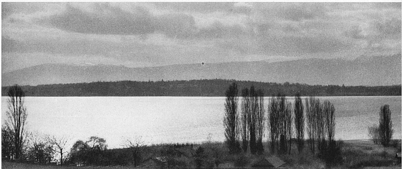
Ci-dessous: Instantanés pris lors du Rallye des neiges 1951. De gauche à droite: De nuit, en s'approvisionnant d'essence; l'arrivée à Genève.