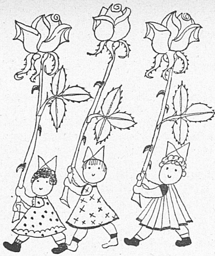
Vignetten von - Vignettes de Hans Fischer