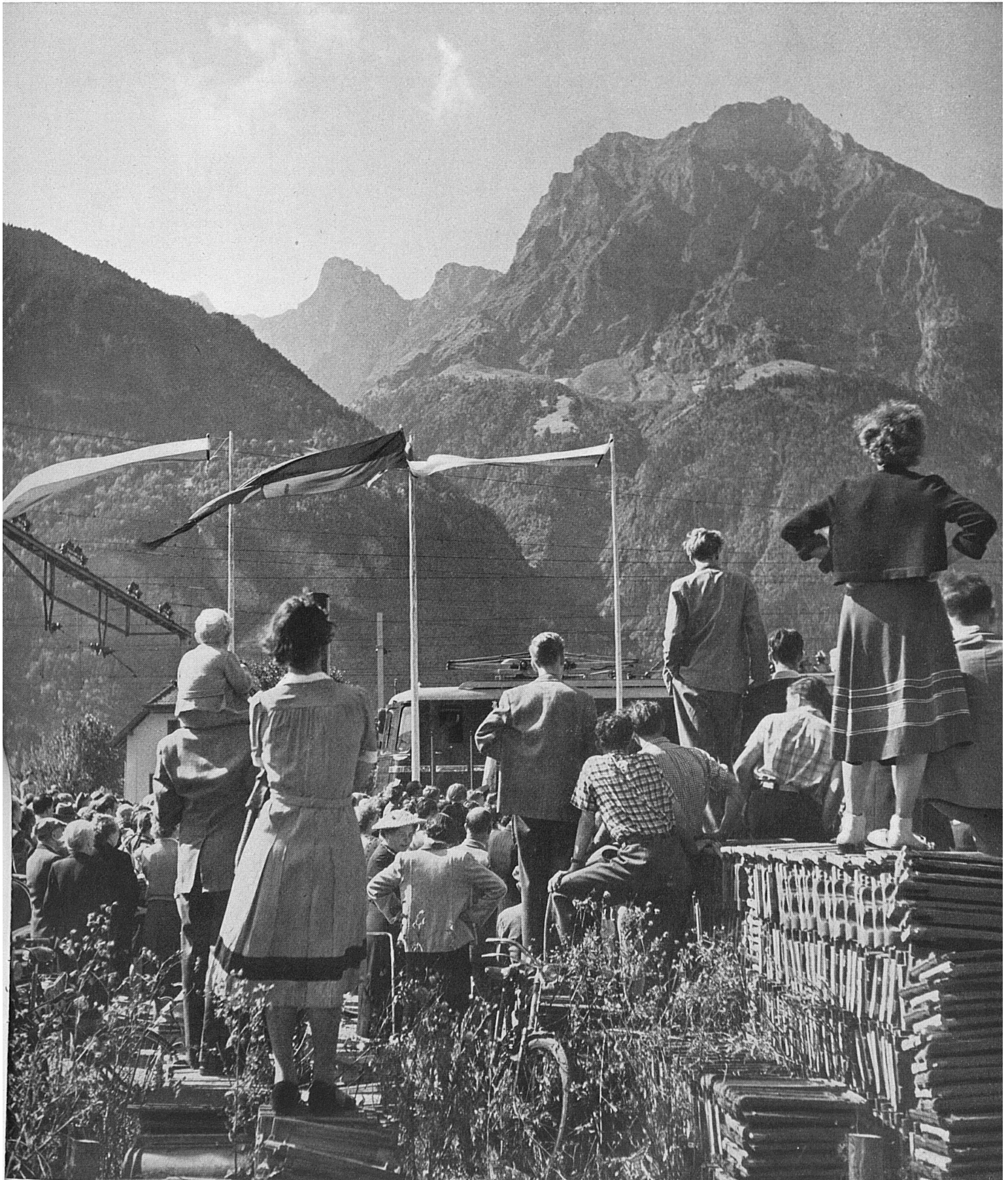
La gare d'Altdorf, le 23 septembre, parée pour le baptême solennel d'une nouvelle locomotive nommée «Uri».