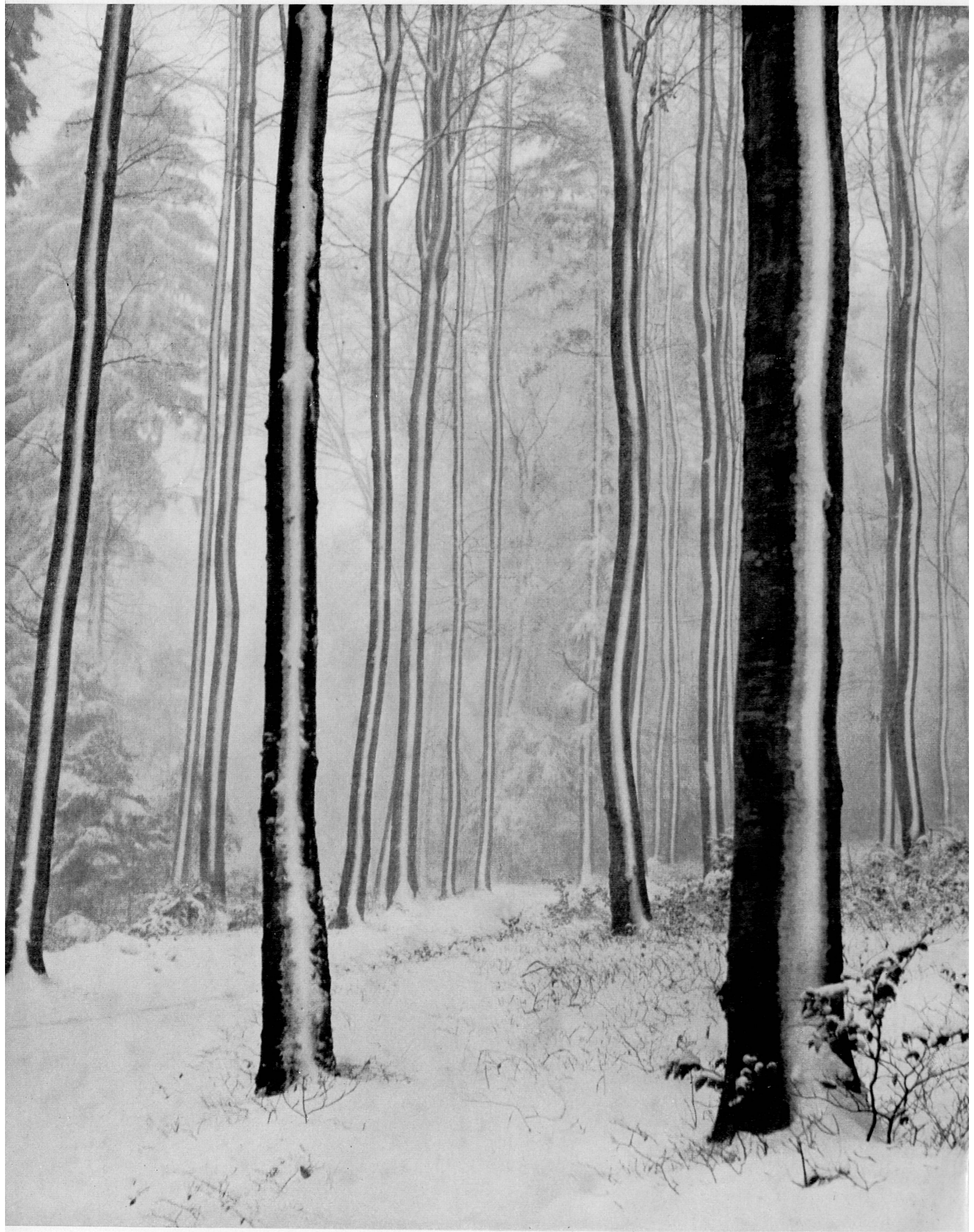
Über Weidland und Wälder legt sich der Winter und entfaltet ein Spiel der Kontraste. L'hiver s'étend sur champs et forêts et déploie des jeux de contrastes. L'inverno stende la sua coltre su boschi e pascoli in un giuoco suggestivo di contrasti. Snow over pastures and forests often creates a pattern of sharp contrasts. El invierno se extiende sobre prados y bosques, en un juego de contrastes.