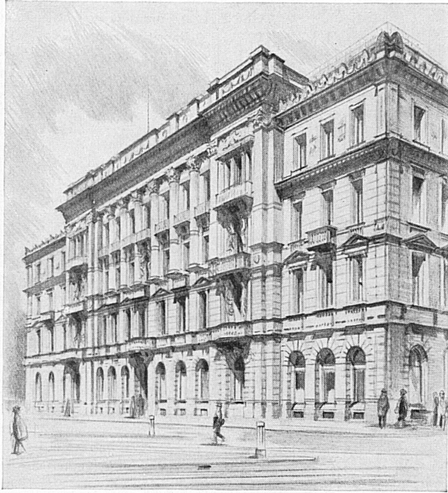
Hauptplatz in Zürich