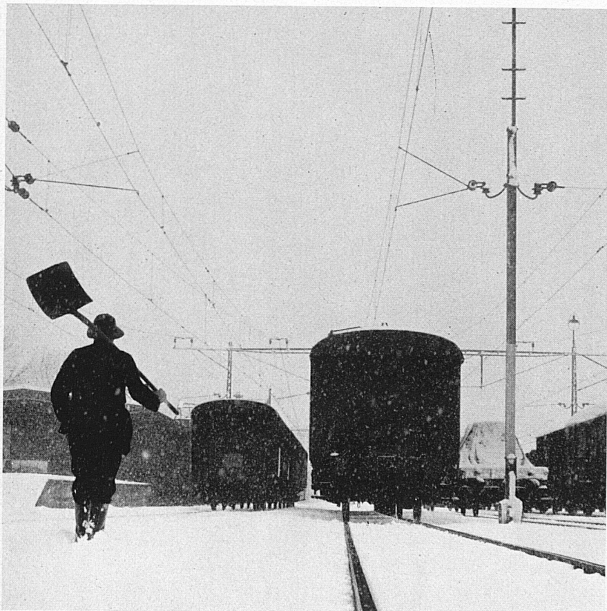
In den verschneiten Bahnhofanlagen von Le Locle im Neuenburger Jura. La gare du Locle (Jura neuchâtelois) sous la neige. Gli impianti di stazione di Le Locle (nel Giura neocastellano) ricoperti di neve. The snowed-in railway station at Le Locle in the Jura mountains.

Dining-car comfort is the subject of the most recent poster issued by the Publicity Department of the Swiss Federal Railways. Design: Hugo Wetli.