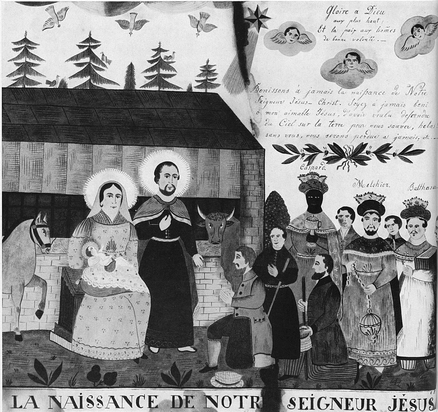
Christi Geburt, gemalt von G. Frédéric Brun, genannt der Deserteur (siehe Text Seite 8) «Nativité», peinture de G. Frédéric Brun, surnommé le déserteur (voir texte page 8) «La Natività di Cristo», dipinto di G. Frédéric Brun, detto il Desertore (vista testo a pagina 8) «The Birth of Christ» by G. Frédéric Brun, known as «The Deserter» (see page 9)