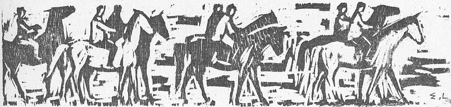
Holzschnitt | Bois: Ernst Leu (zur Ausstellung im Kursaal Heiden, bis 21. August).