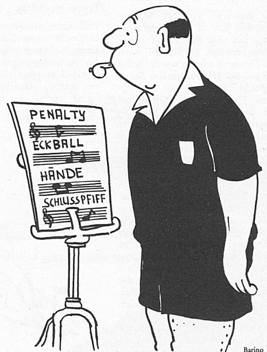
Schiedsrichter im Training