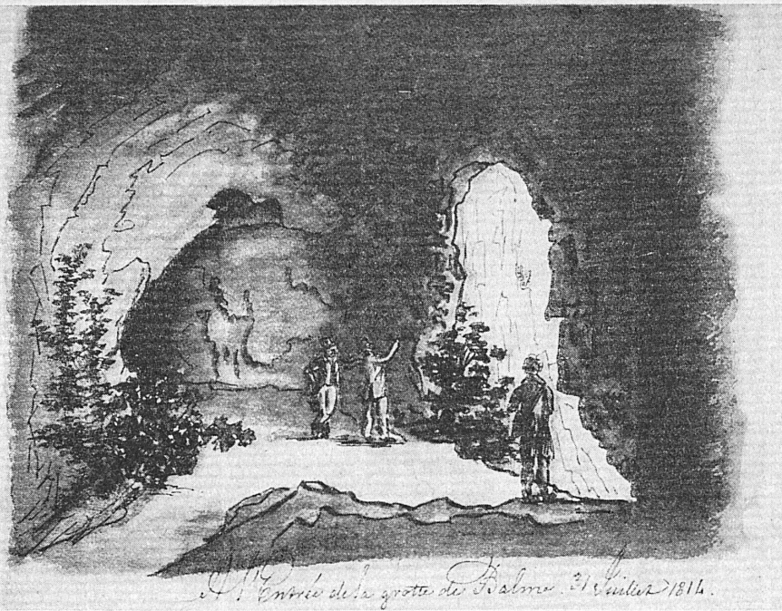
Entrée de la grotte de Balme. 31 juillet 1814.