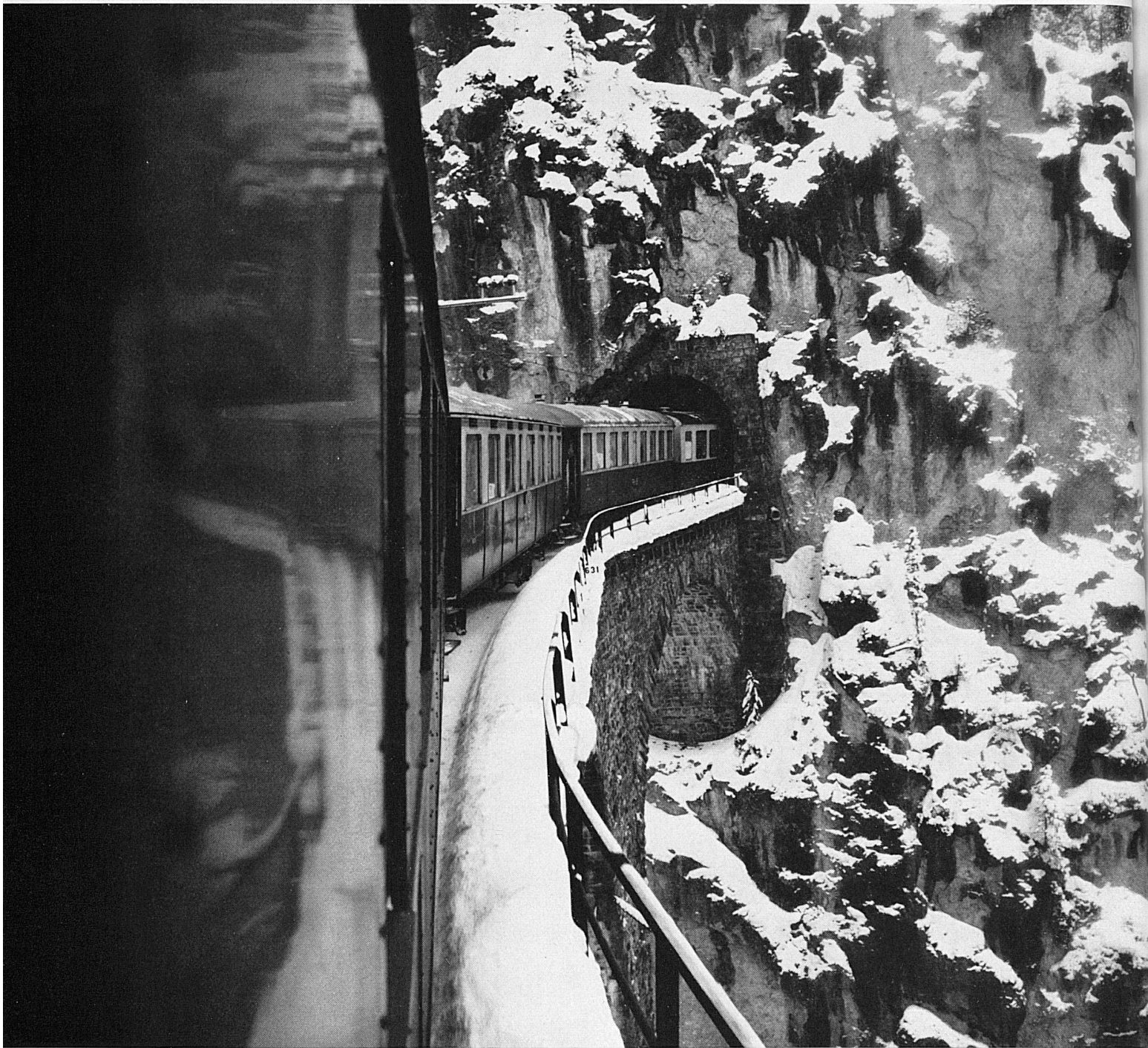
Fahrt mit der Rhätischen Bahn über den Viadukt bei Filisur in den Bergwinter Graubündens.

Un convoi du Chemin de fer rhétique franchit le viaduc de Filisur.