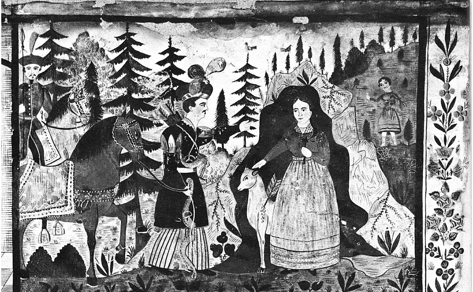
Silvot, pour faire un banquet, aux seigneurs du voisinage, va chasser dans la forêt, suivi d'un grand équipage; quand la biche dont le lait nourrit son fils au berage; se sauve vers le rocher, que Dieu ne veut plus cacher.