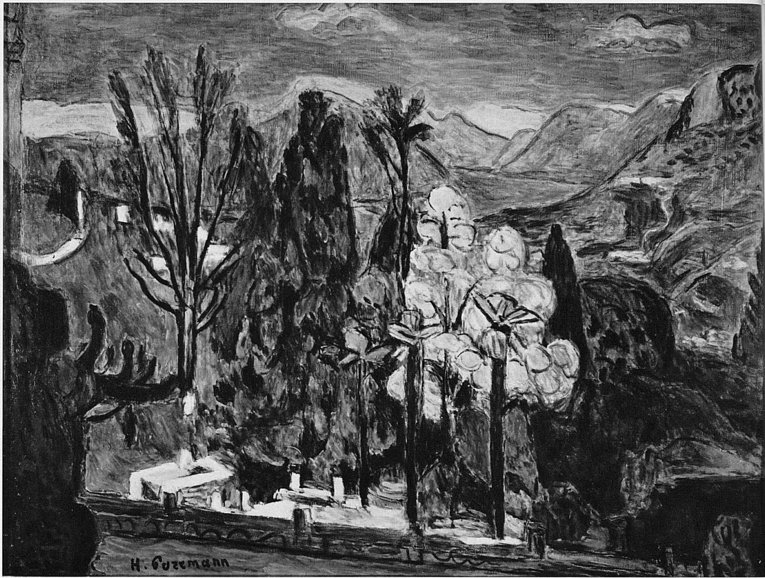
HANS PURRMANN, 1961 Südtessiner Landschaft mit Blick auf den Luganersee Paysage tessinois avec échappée sur le lac de Lugano Paesaggio del Sottoceneri, con vista sul lago di Lugano Landscape in the Southern Ticino with view of the Lake of Lugano