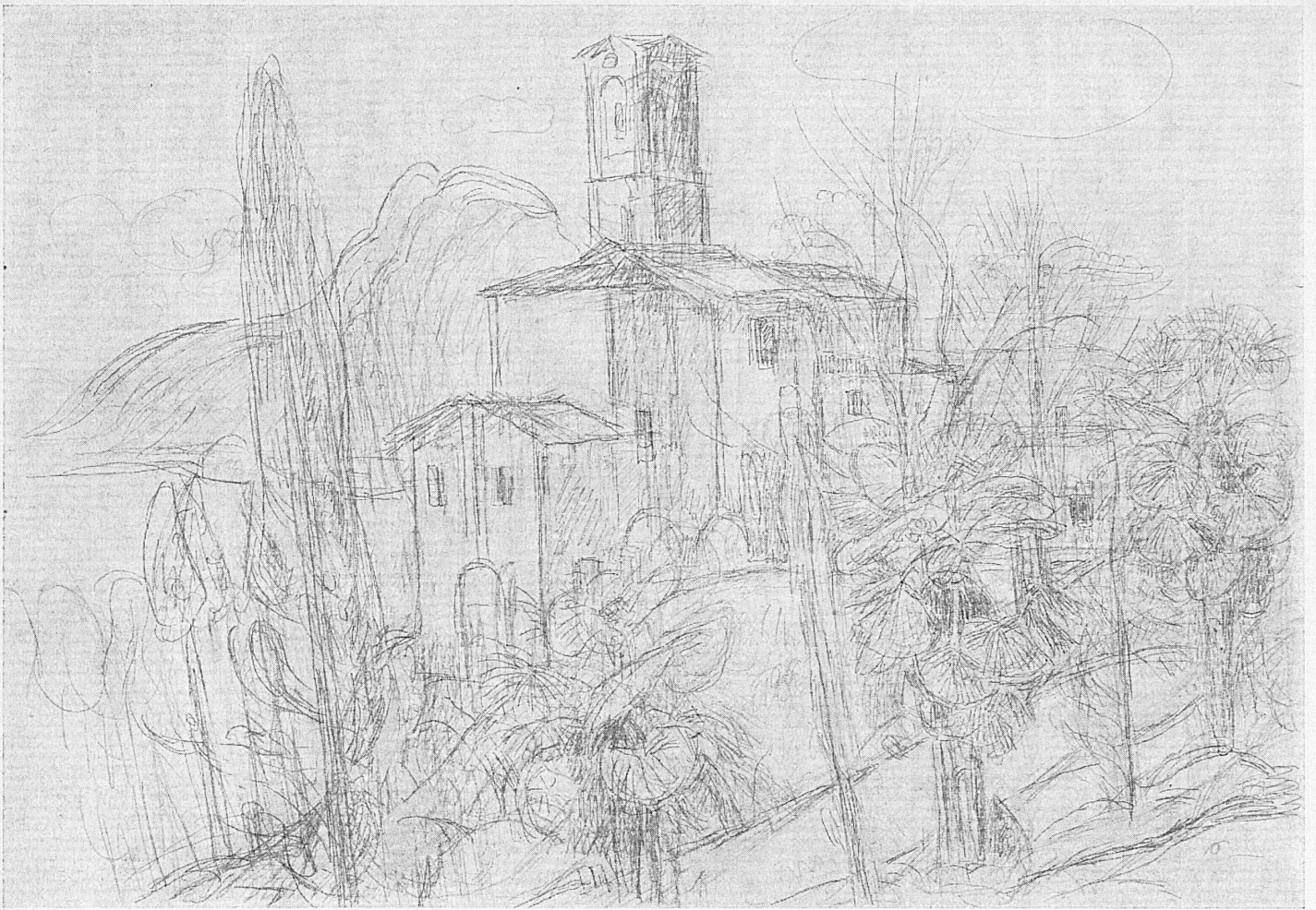
HANS PURRMANN: Castagnola, 1943/1944

ZUR AUSSTELLUNG HANS PURRMANN † IM KUNSTHAUS AARAU 14. V. – 12. VI. L'EXPOSITION HANS PURRMANN † AU MUSÉE DES BEAUX-ARTS D'AARAU ESPOSIZIONE COMMEMORATIVA DI HANS PURRMANN † AL KUNSTHAUS DI AARAU