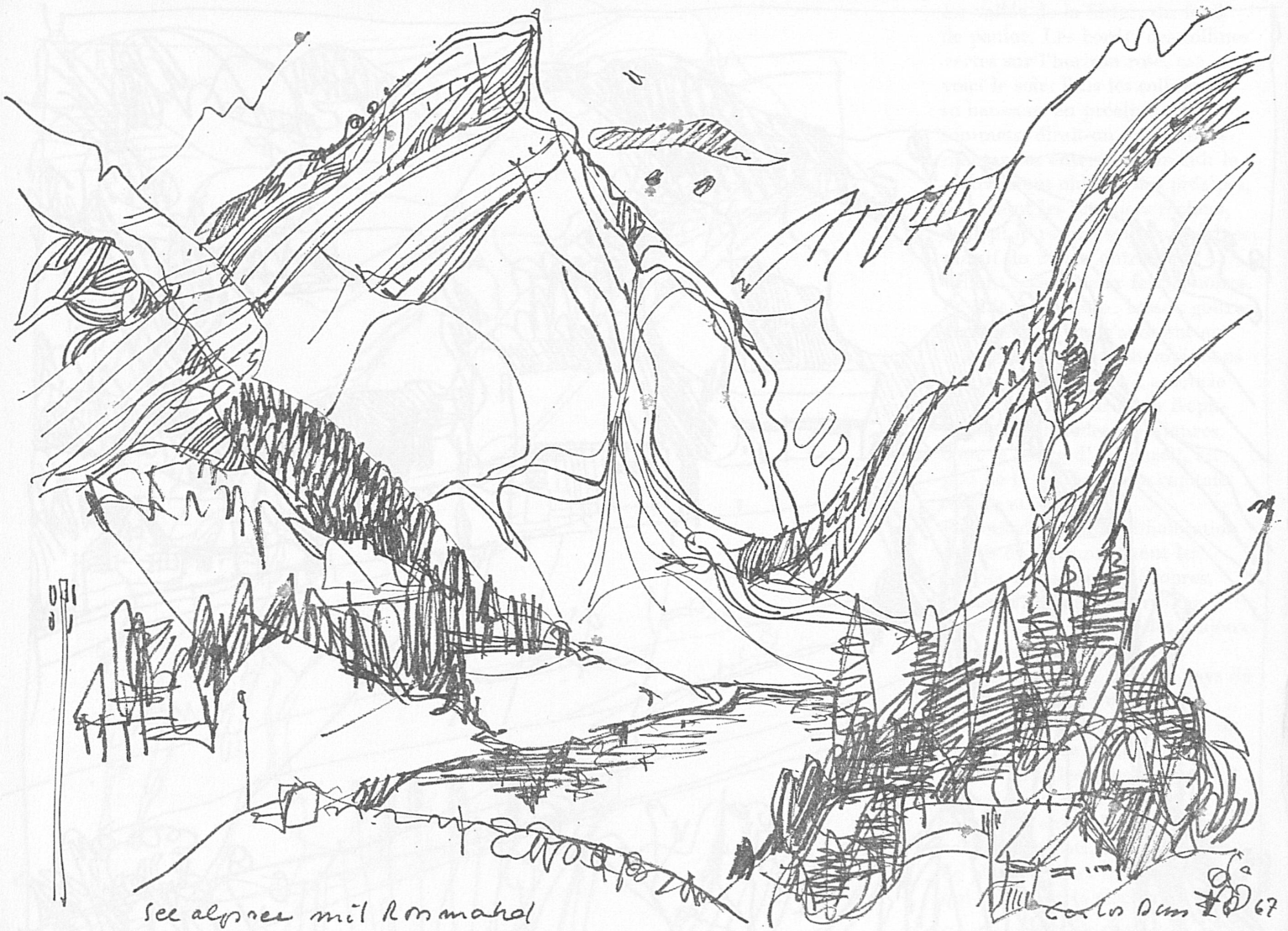
See alpines mit Rommatal