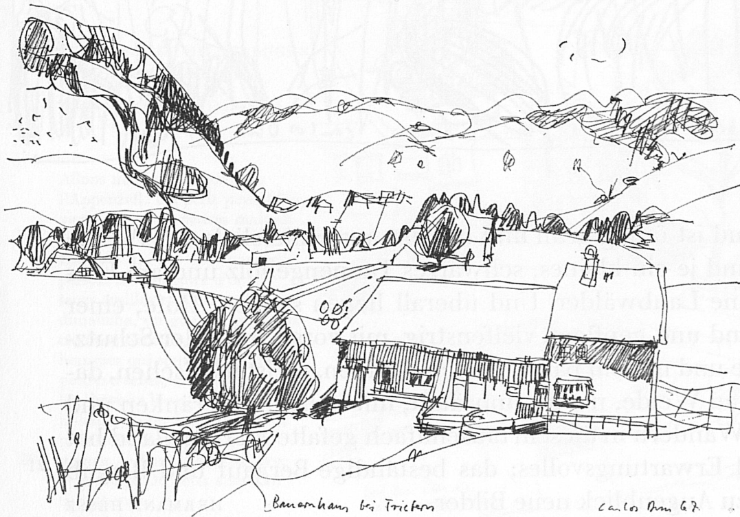
Baumhaus bei Trichern