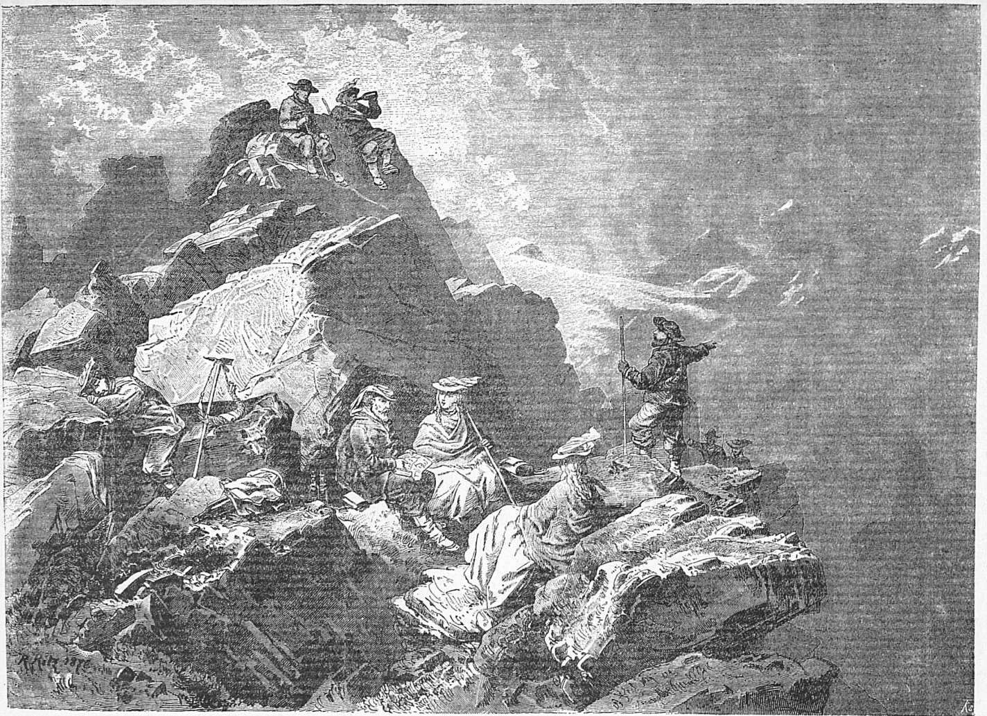
Pic d'Arzinol, Valais/Wallis, 1876