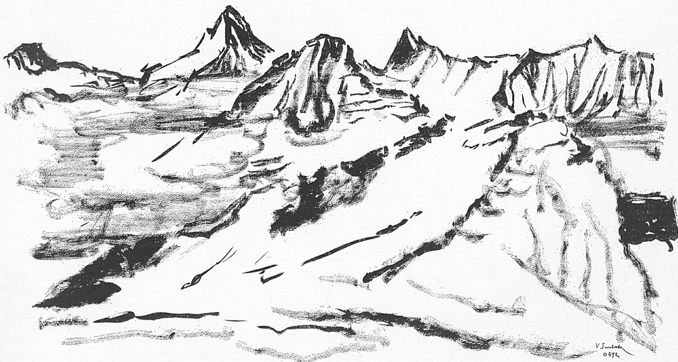
Victor Surbek: Schreckhorn und Finsteraarhorn, Tuschzeichnung • Le Schreckhorn et le Finsteraarhorn, lavis Schreckhorn e Finsteraarhorn, disegno all'inchostro di China • El Schreckhorn y el Finsteraarhorn, dibujo a tinta de china Schreckhorn and Finsteraarhorn, Indian-ink sketch

Un livre récent: «Von der Krinoline zum sechsten Grad» (aux Editions: das Berglandbuch, Salzbourg) présente avec force détails pittoresques le développement de l'alpinisme féminin. Il a été évoqué, le 16 mai 1968 au sommet du Titlis, par les meilleures représentantes de ce beau sport, venues de Grande-Bretagne, de France, d'Espagne, des Pays-Bas, d'Allemagne, de Pologne, de Tchécoslovaquie, d'Autriche, de Yougoslavie, d'Italie et de Suisse. Accompagnées d'époux non moins célèbres, elles ont pratiqué pendant une semaine la varappe et le ski dans la région d'Engelberg.