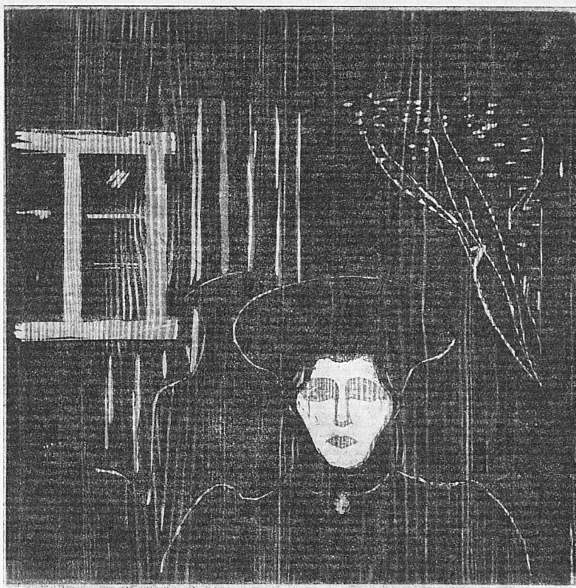
Edvard Munch, 1901: Mondschein, Holzschnitt • Clair de lune, gravure sur bois Chiaro lunare, silografia • Moonlight, wood-cut