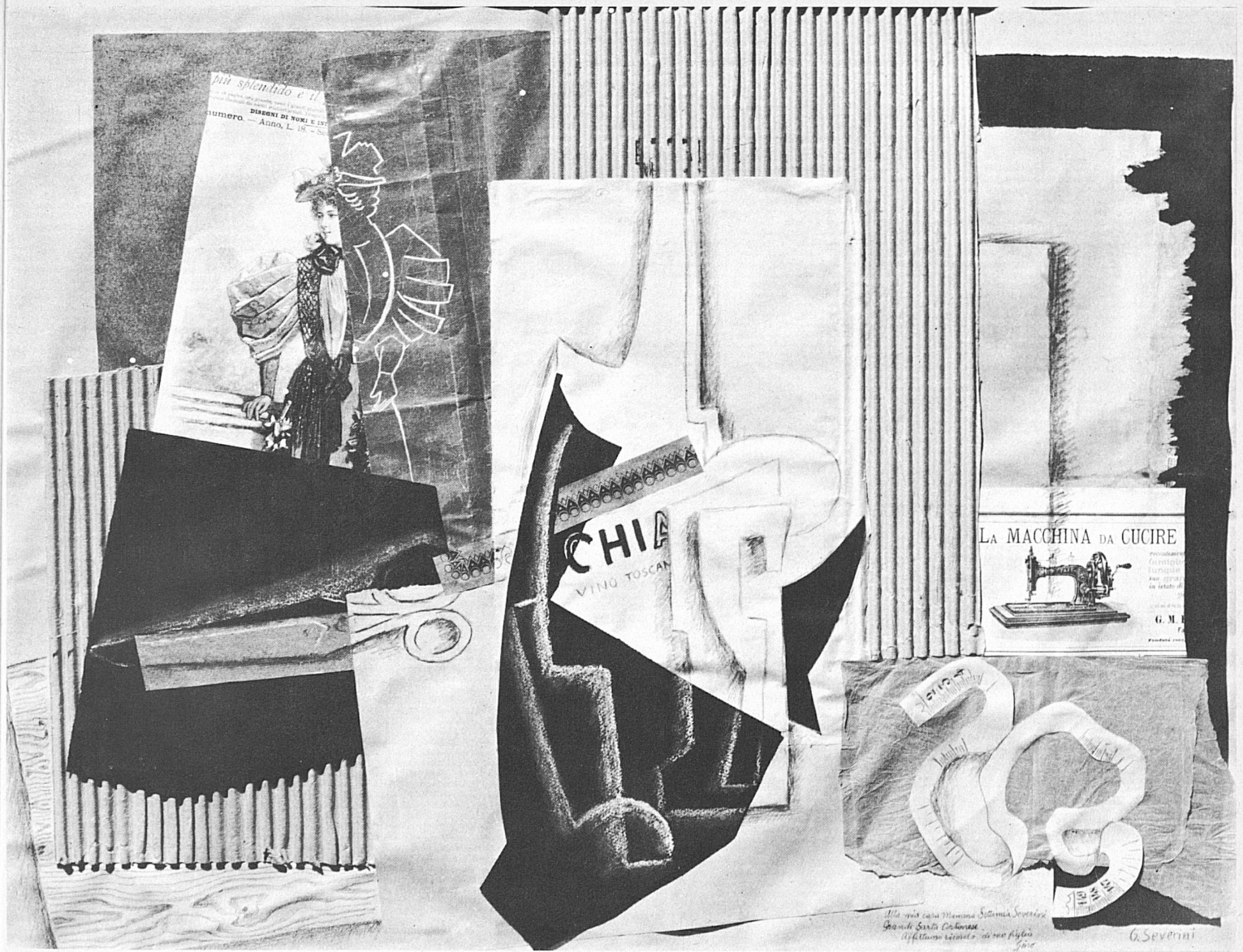
Gino Severini, «Hommage à ma mère», 1912. Collage 56 × 72 cm.

blages», die erstmalig Collage als historisches Phänomen und zugleich als gegenwartsbezogenes künstlerisches Ausdrucksmittel vorstellte. Die Anfänge der Collage liegen bei Braque, der schon 1909 einen Nagel als Trompe-l'œil in ein Bild malte, später Buchstaben einfügte und als konsequente Weiterentwicklung seit 1912 Papierstücke in seine Bilder und Zeichnungen einklebte. Die Wirklichkeit wurde nicht mehr vorgetäuscht – wie im Gemälde mit dem illusionistisch gemalten Nagel, sondern war selbst zum Teil des Bildes geworden. Die Erfindung Braques – das Papier collé – wurde eine für den Kubismus entscheidende Bilderfindung. Schwitters tat den Bruch mit den überlieferten Traditionen am entschiedensten: er gab die Malerei zugunsten der Collage auf und hinterliess ein echtes Collage-Œuvre, das sowohl auf architektonische Aspekte – seinen berühmten Merzbau – bis zu Wortgedichten in Collageform ausstrahlte. Jeg-