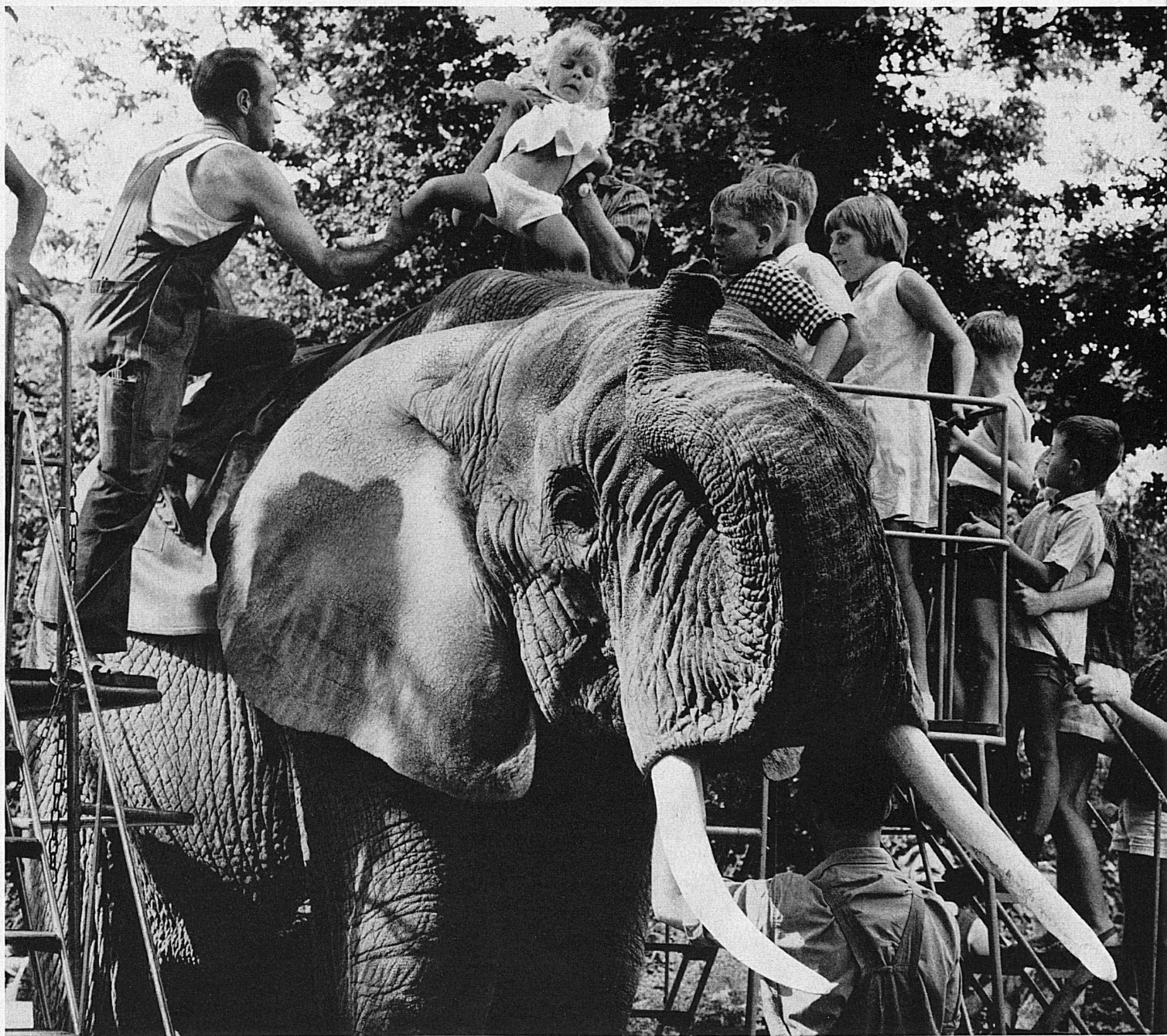
Reitvergnügen auf einem afrikanischen Elefanten im Basler Zoo. ▶ Jeunes «cornacs» au Zoo de Bâle

Il piacere d'una cavalcata sul dorso d'un elefante africano nel Giardino zoologico di Basilea Riding pleasures in the Basle Zoo. The tinies experience the thrills of adventure while the big one may well dream of native Africa