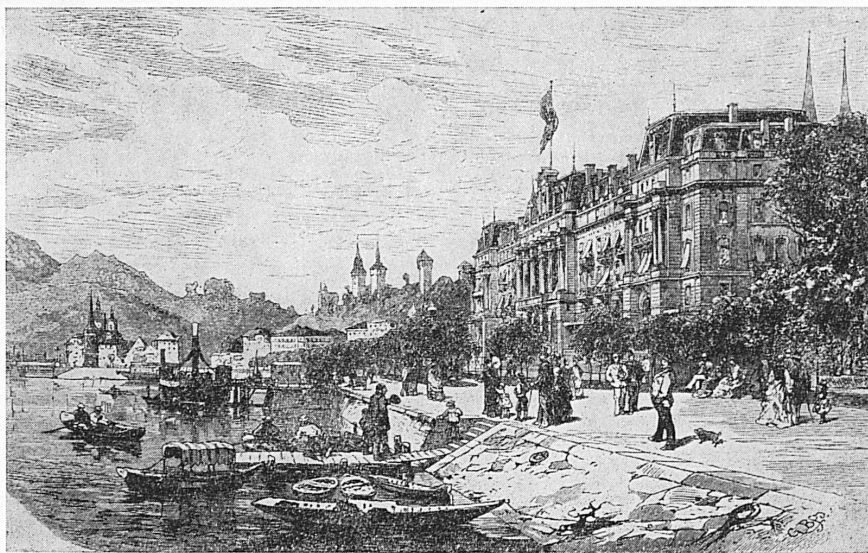
Luzern/Lucerne: Hotel National.

Ritz dem verzweifelnden Direktor als Retter in der Not. Er stellte das Menü um, setzte anstelle des Hors-d'œuvre eine heisse Bouillon, anstelle des Fruchteises Crêpes flambées, und als die 40 Gäste den Speisesaal betraten, entströmte 4 grossen, kupfernen Kesseln, aus denen normalerweise in der Eingangshalle Palmen ragten, die behagliche Wärme eines Holzkohlenfeuers, während jeder die Füsse auf einen heissen, in Wolle gehüllten Backstein setzen konnte. Wann und wo immer Ritz neue Hotels eröffnete, stets überraschte er seine Gäste mit Neuem. Im Grand-Hotel in Rom, abgeschreckt durch die scheusslichen Jugendstillampen, brachte er die indirekte Beleuchtung an. Immer blieben ihm seine früheren Gäste treu, eine so magische Anziehungskraft strahlte sein Name aus. Sie wussten, dass die Appartements der höchsten Stufe des kultivierten Geschmacks entsprachen, sie wussten aber auch, dass für Ritz die Qualität der Küche ausschlaggebende Bedeutung hatte. Wie manches Grand-Hotel hatte er durch die radikale Verbesserung der kulinarischen Leistungen aus der Defizitphase gerettet. Aus diesem Grunde hatte ihn auch Oberst Pfyffer, mit dessen Familie ihn zeit seines