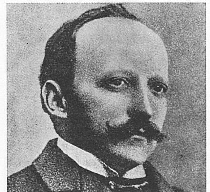
César Ritz, 1850–1918

der europäischen Grossmachtpolitik, des schrankenlosen wirtschaftlichen Liberalismus, des Zeitalters der Maschine, der Eisenbahnen, der Seeschifffahrt, des Telegraphen – mit dem Aufkommen der neuen Verkehrs- und Kommunikationsmittel, auch des sich rasch entfaltenden, von keinem Pass und anderen Formalitäten belasteten Fremdenverkehrs. Damals reisten zunächst vor allem Fürstlichkeiten, die Angehörigen des europäischen Hochadels, prominente Staatsmänner und Militärs, die Grössen der Wissenschaft, Literatur und der Bühnenswelt und schliesslich die Magnaten von Handel, Industrie und der Hochfinanz – die Vanderbilts, Morgans und Rothschilds –, südamerikanische Plantagenbesitzer und südafrikanische Gold- und Diamantenkönige, kurz die damalige gesellschaftliche Oberschicht, die den Reichtum verkörperte und die dem Luxus und dem Vergnügen lebte. Sie besaßen Schlösser und Herrensitze, aber die Stätten gesellschaftlicher Geltung waren für sie das Hotel, wo bei festlichen Dinern und rauschenden Bällen die Damen mit kostbaren