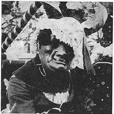
DAS NARRENFEST DER LUZERNER

So kann sich die Luzerner Fastnacht nennen – aber sie ist in ihrer originalen Gestalt stets auch ein attraktiver Treffpunkt auswärtiger Gäste. Am 22. Februar beginnt sie mit einem grossen Umzug, der am folgenden Montag, 26. Februar, wiederholt wird. Den klanggewaltigen Abschluss findet sie traditionsgemäss tags darauf, am 27. Februar, mit einem Monsterkonzert sämtlicher Guggenmusiken auf dem Mühlenplatz. Das volksfestliche Leben aber hört damit noch nicht auf. Der Schlußtag vor der Fastenzeit will bis spät in die Nacht hinein ausgekostet werden – die Gassen der Altstadt und die Gaststätten wissen ein Liedchen davon zu singen.