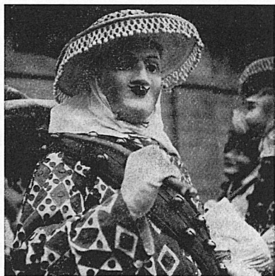
DER BARTLI VON BRUNNEN UND DER «HARLINGGG»

In Brunnen am Vierwaldstättersee regiert über die Fastnachtszeit als guter Geist der Bartli. Schon im 15. Jahrhundert hat er durch die Gassen des alten Surtortes gegeistert und durch sein tolles Treiben den kommenden Frühling angekündigt. Von diesem Brauch her rührt wohl auch das Verbrennen des «Harlingggs», eines Wintersymbols ähnlich dem Böögg des Zürcher Sechseläutens, oder dem «Hom Strom» in Scuol im Engadin. Heute marschiert der Bartlivater, der jedes Jahr als Obmann der Bartligesellschaft neu gewählt wird, durch Brunnen und bereitet am Schmutzigen Donnerstag – also am 22. Februar – auf dem Platz vor der Brunner Kapelle eine grosse Bescherung für die Gaben heischenden Buben und Mädchen vor. In früheren Zeiten pflegte die Bartligesellschaft ein Fastnachtsspiel, das der Volksjustiz dienende Bartlispieldarstellung aufzuführen. An allen drei offiziellen Fastnachtstagen (22., 26. und 27. Februar) zieht in Brunnen vom Morgen bis zum abendlichen Betglockenläuten die «Rott» von Wirtshaus zu Wirtshaus (ursprünglich wohl von Bauernhaus zu Bauernhaus) und tanzt zum erregenden Rhythmus der Trommeln einen uralten Kultanz. Das ist das Nüsslerreiben, so benannt, weil einst unter das zuschauende Volk Nüsse ausgeteilt wurden.