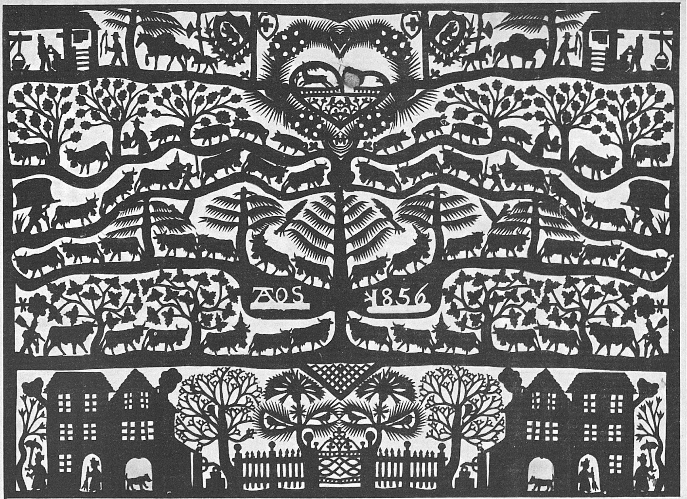
Der im Text beschriebene, 1856 datierte und mit den Initialen des Auftraggebers versehene Scherenschnitt von Johann Jakob Hauswirth Format 38 × 28 cm

Papier découpé de Johann Jakob Hauswirth, 1808–1871, voir texte de la page 12 Salita all'alpe, lavoro a ritagli di Johann Jakob Hauswirth, 1808–1871. Vedasi il testo a pagina 12 Silueta recortada con tijera por Juan Jacobo Hauswirth, 1808 a 1871. Véase texto en la página 12 Scissor-cut by Johann Jakob Hauswirth, 1808–1871. Cf. text on page 12