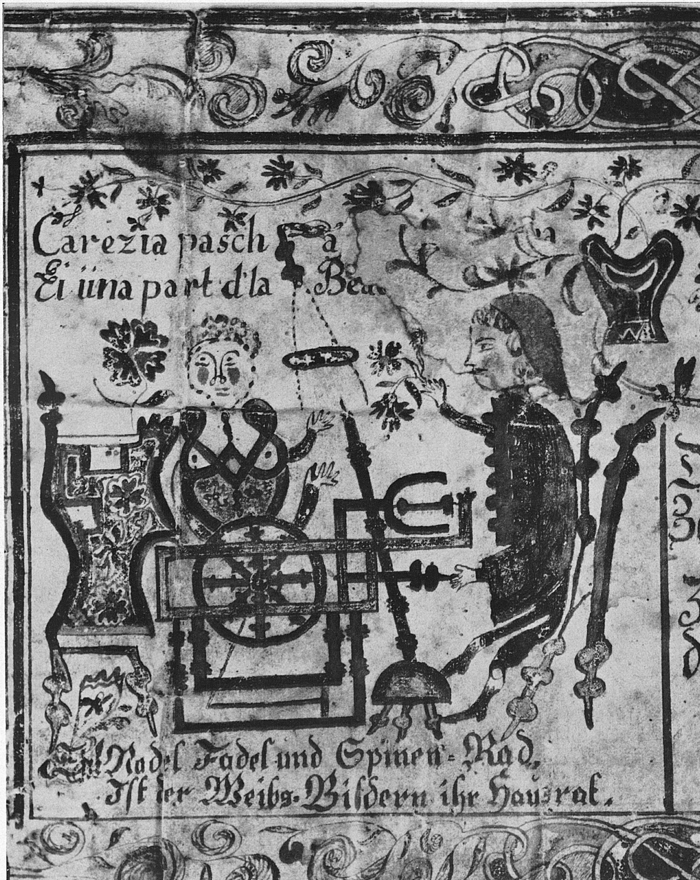
Teilstück eines Kunkelbandes aus Donath, Graubünden, datiert 1838, Minnegabe (vergrössert). Aus der Ausstellung «Schweizerische Volkskunst» im Schweizerischen Museum für Volkskunde, Basel (bis 3. Juni).