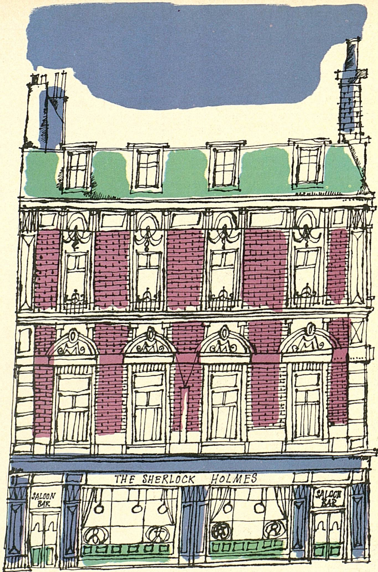
Die Sherlock-Holmes-Gaststätte an der Northumberland Street in London Le restaurant fréquenté par Sherlock Holmes, Northumberland Street, Londres La taverna di Sherlock Holmes in Northumberland Street a Londra El restaurant frecuentado por Sherlock Holmes en la Northumberland Street de Londres The Sherlock Holmes Inn in Northumberland Street, London