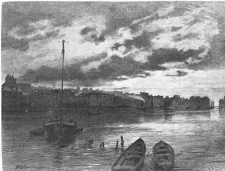
Genf zur Zeit von Sir Arthur Conan Doyle • Genève au temps de Sir Arthur Conan Doyle Ginevra al tempo di Sir Arthur Conan Doyle Ginebra en el tiempo de Sir Arthur Conan Doyle • Geneva at the time of Sir Arthur Conan Doyle

Im Frühjahr 1968 hat ein Trupp von vorwiegend englischen «Holmesians» die Schweiz in den Fussstapfen des grossen Detektivs durchreist. Über der Schlucht der Reichenbachfälle registrierten die Besucher mit Genugtuung, dass die im «Letzten Fall» beschriebene Kulisse des Todeskampfes bis ins letzte Detail der Wirklichkeit entspricht. Einmal mehr werden sich vermutlich die Verehrer des weltberühmten Detektivs gefragt haben, ob nun Holmes und Watson wirklich nur Romanfiguren gewesen seien und ob der böse Moriarty wirklich nicht unter den in die Tiefe stürzenden Wassermassen begraben liege.