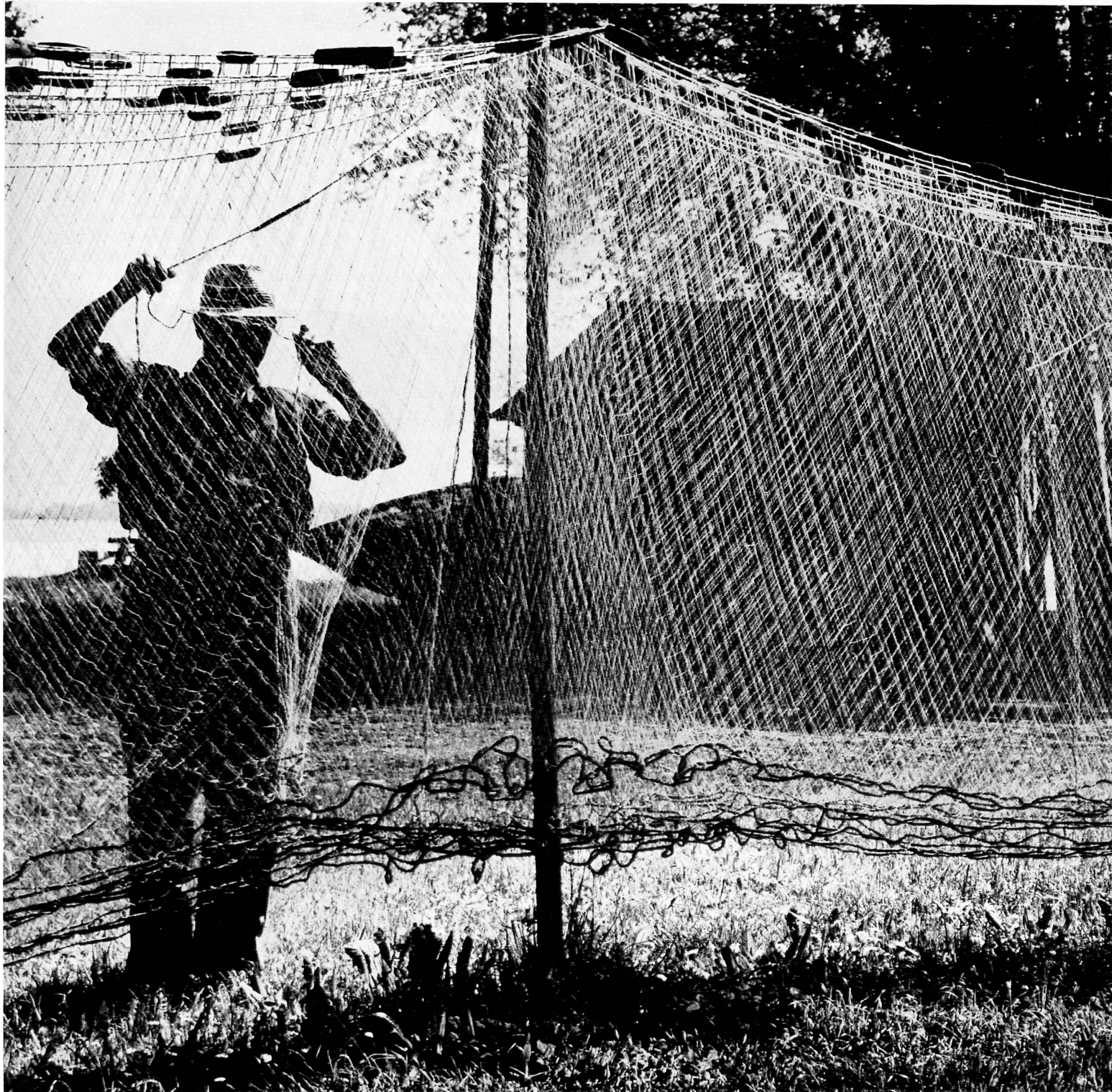
▲ Fischer bei Ermatingen am Untersee, Kanton Thurgau Pêcheur à Ermatingen, lac Inférieur (Thurgovie) Pescatore d'Ermatingen, sull'Untersee (bacino inferiore del Bodano) A fisherman spreads his nets to dry near Ermatingen, on the lower part of the Lake of Constance