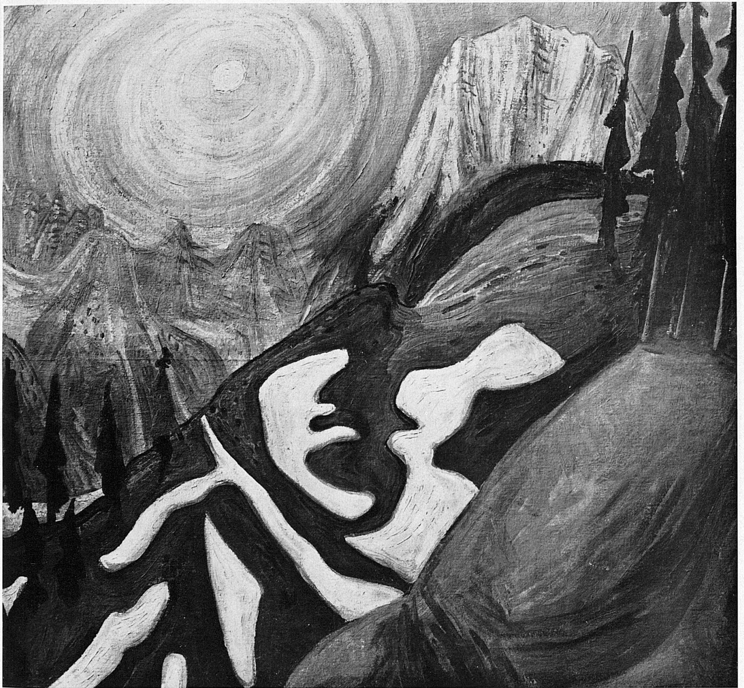
Fritz Pauli, 1924: Mondnacht in den Bergen / Lune dans les montagnes Notte di luna sui monti / Moonlight Night in the Mountains . Photo Steinemann, Locarno