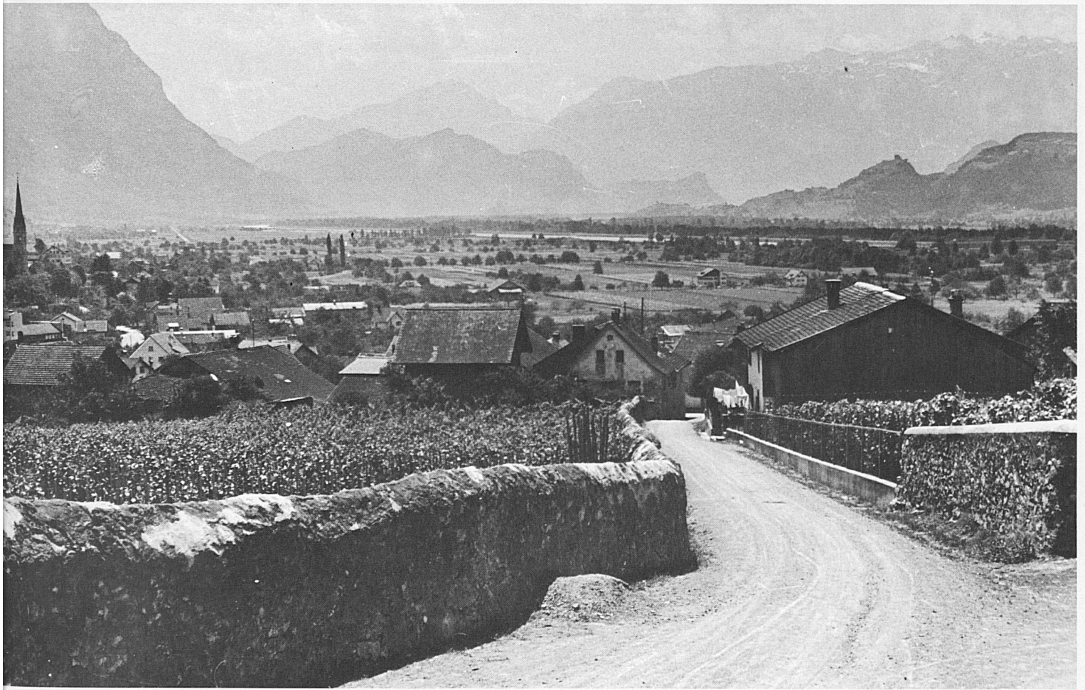
Alt-Vaduz, Liechtensteiner und St.-Galler Oberland. Alt-Vaduz, Oberland del Liechtenstein e di San Gallo