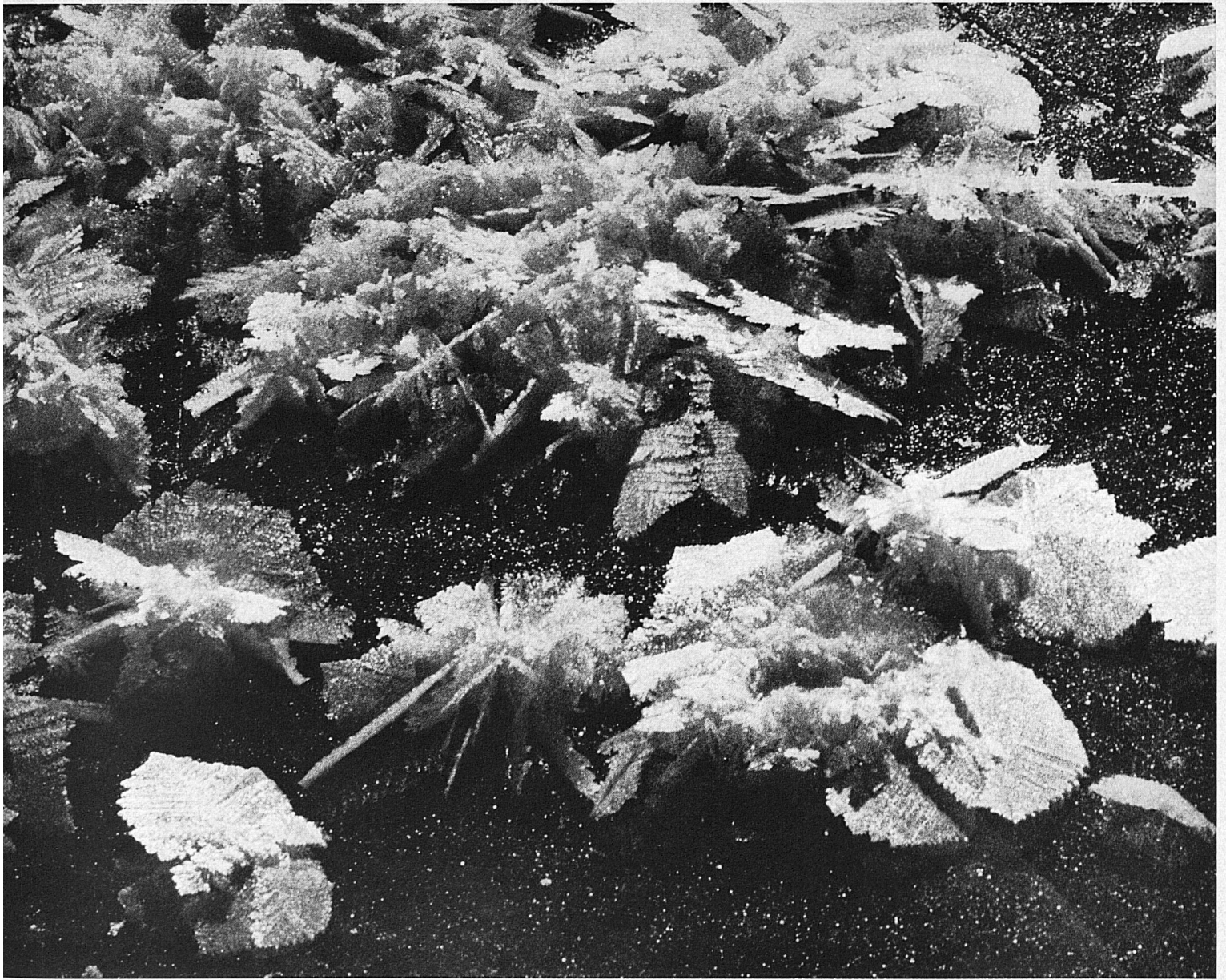
Märchenhafte Eisblüten auf dem Davosersee, aufgenommen am 26. Dezember 1970.

Merveilleuses fleurs de glace sur le lac de Davos. Photo prise le 26 décembre 1970