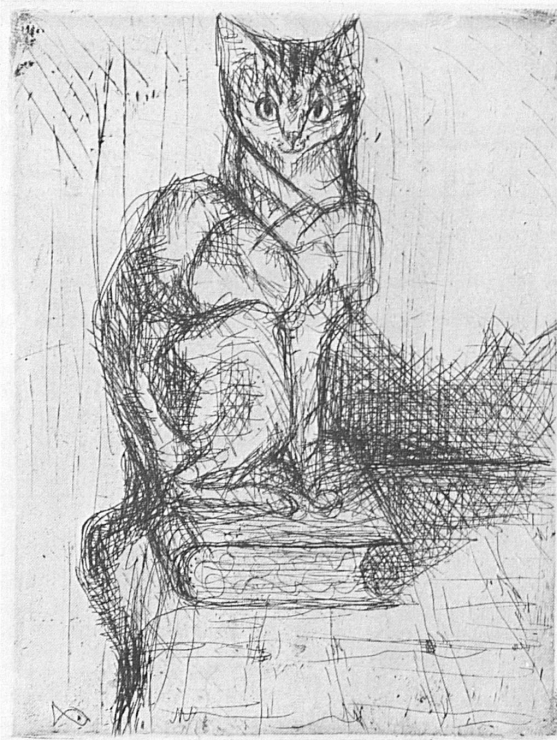
Radierung von fis (Hans Fischer, 1909–1958)

It goes without saying that art dealers and antiquaries not only from Basle, Berne, St. Gallen, Lucerne and Zurich, but also from Lugano, Lausanne, Geneva, Neuchâtel and many smaller towns, do their utmost to display something out of the ordinary. In this sense the 1973 annual fair reveals an exceptional profusion and splendour. Many visitors are also expected from neighbouring countries.