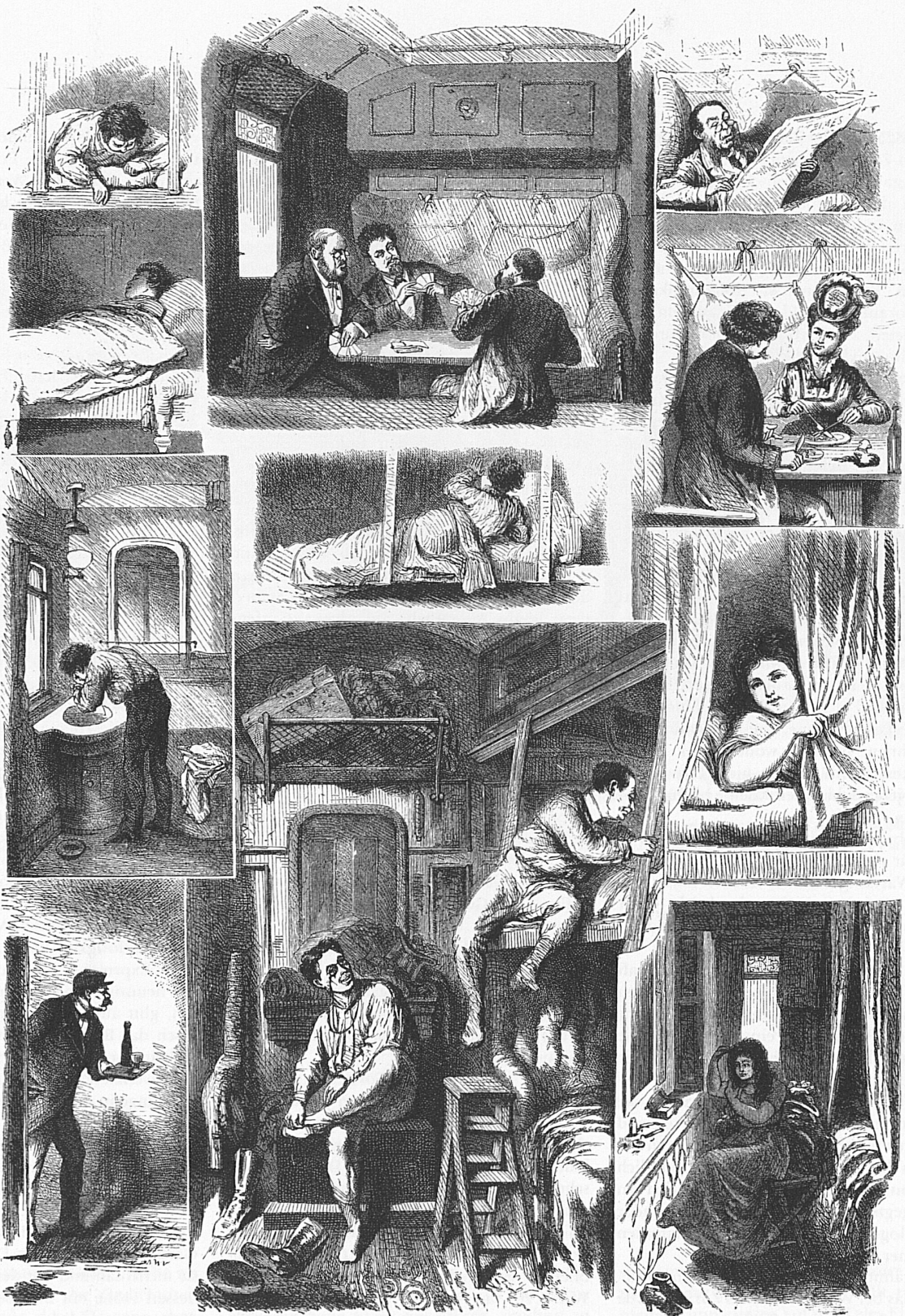
Im Schlafwaggon. Gezeichnet von G. Kestel.