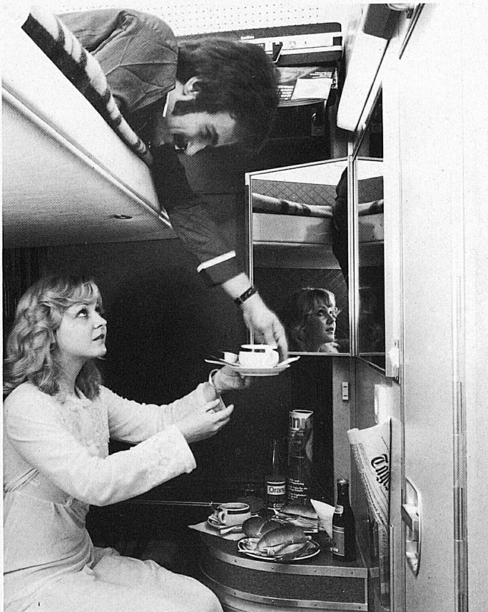
A T2S sleeping car. Below: compartments as they appear in the day and at night Right-hand page: Sleeper travel in 1876