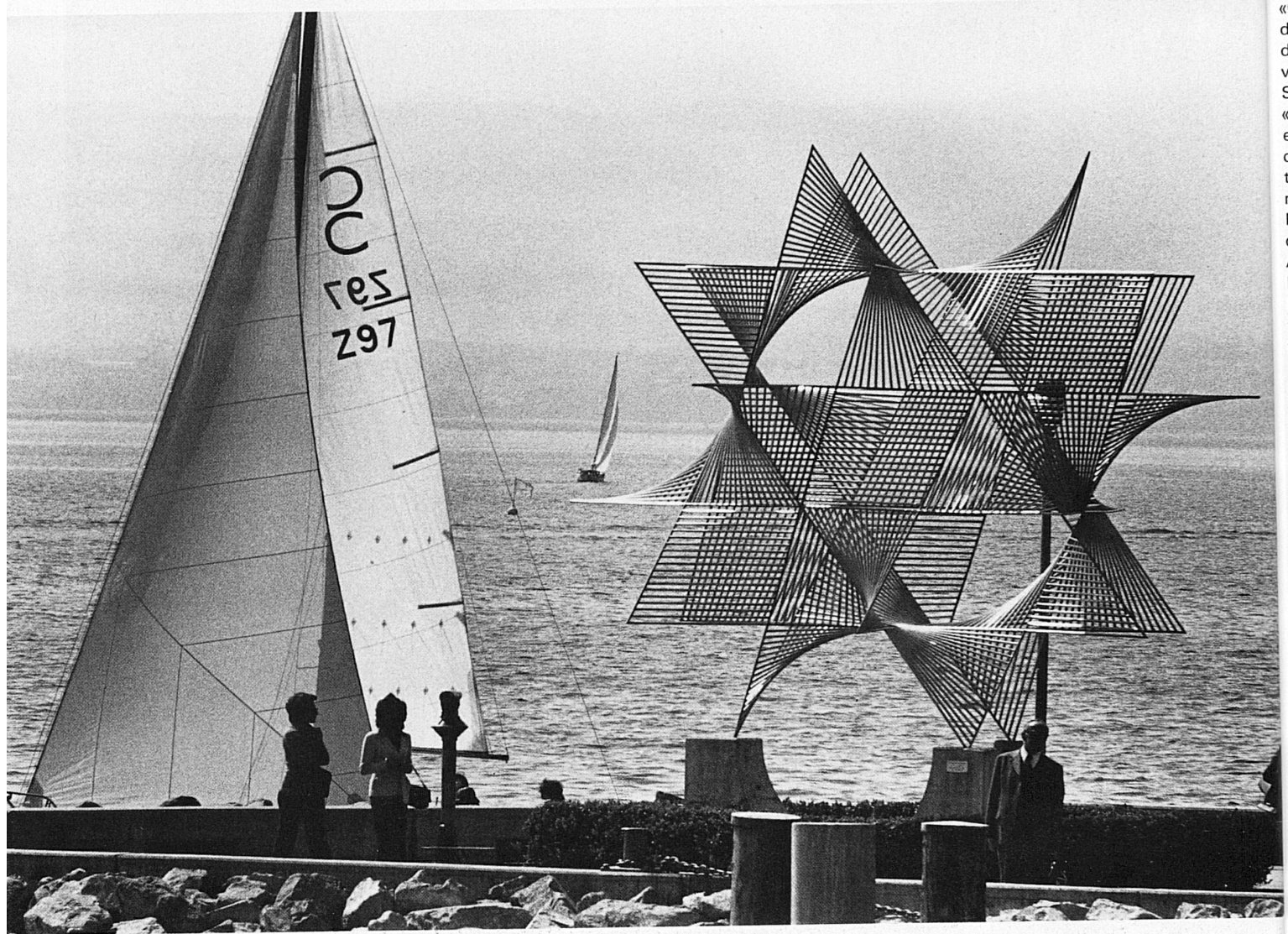
A. Duarte: Ouverture au monde , 1973, Port d'Ouchy.