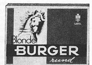
10 / 3.- mild