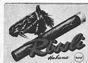
10 / 3.- würzig-mild