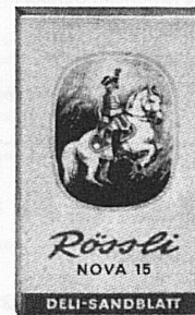
10 / 2.40 sehr leicht