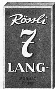
10 / 2.20 extra preiswert