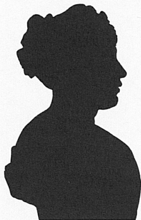
Madame de Staël (1766-1817)

On the occasion of a year dedicated to Europe's Architectural Heritage and to the Rights of Women: Coppet Castle and M me de Staël