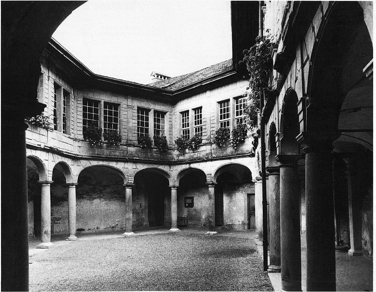
Fünfeckiger Arkadenhof im Schloss Aubonne (Kanton Waadt), ehemaligen Sitz der Herren von Aubonne, Ministerialen der Herrschaft Savoyen. Der prächtige Säulenhof stammt aus dem Beginn des 18. Jahrhunderts.

Cour à arcades pentagonale du Château d'Aubonne (canton de Vaud), ancienne résidence des sires d'Aubonne, fonctionnaires des comtes de Savoie. La splendide cour à colonnades date du début du XVIII e siècle