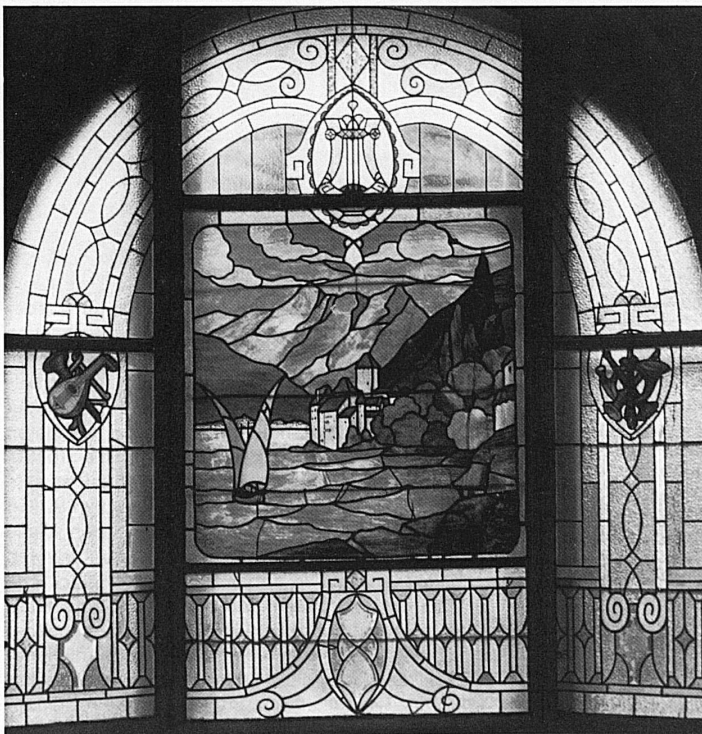
Schloss Chillon am Genfersee, einst Burg der Bischöfe von Sitten und der Grafen von Savoyen, ist mit dem aufkommenden Tourismus zum Inbegriff der Schweizer Schloslandschaft geworden: So erscheint es – wenn auch seitenverkehrt – im Glasfenster eines Wohnhauses in Lodz unweit von Warschau (Anfang 20. Jahrhundert).

Pentagonal arcade courtyard in Aubonne Castle, Canton of Vaud, once the seat of the Aubonnes, officers of the house of Savoy. The splendid pillared courtyard was built in the early 18 th century