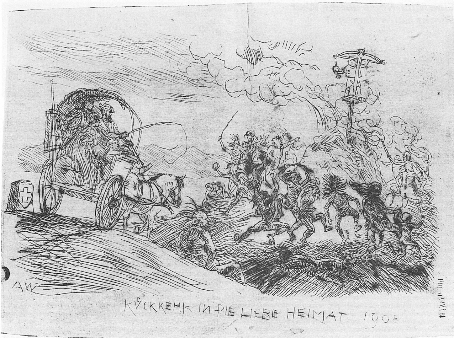
Albert Welti (1862–1912): Rückkehr in die liebe Heimat; 1908, Radierung. Graphische Sammlung der ETH, Zürich Retour dans la chère patrie / Ritorno nella patria amata / Return to the Beloved Homeland

nel, contrairement aux romans comiques illustrés du dessinateur et professeur de rhétorique Rodolphe Toepffer, dont les dessins humoristiques – qu’il nommait son «ânerie» – étaient très estimés par Goethe et exercèrent une grande influence sur Wilhelm Busch (ill. 5). Le plus souvent ce qui était marginal était créé aussi à l’écart: images de fantômes, ballets de sorcières, sabbats infernaux, ne faisaient pas l’objet de commandes, mais étaient exécutés en petit format dans le cercle restreint des artistes. Un échange typique de gravures satirico-comiques avait cours dans la Société des artistes zuricois où, à partir de 1795, il fut d’usage que chaque membre fit don mensuellement d’un dessin pour ce qu’on appelait les «livres des peintres». Le Musée des beaux-arts de Zu-