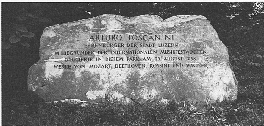
First International Music Festival of Lucerne, 1938: Arturo Toscanini conducts a concert in front of the Wagner house at Tribschen

1938 – prime Settimane musicali internazionali a Lucerna. A Tribschen, davanti alla casa di Wagner, Arturo Toscanini diresse un concerto