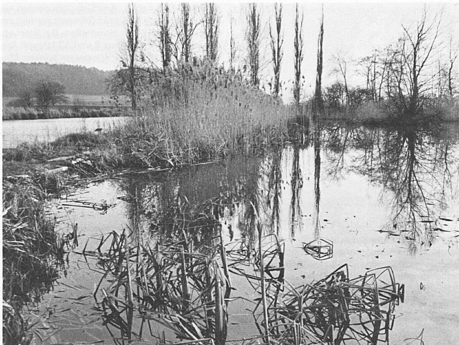
Eine intakte Sumpf- und Röhrichtlandschaft ist das Neeracher Ried im Kanton Zürich. Es wurde rechtzeitig unter Naturschutz gestellt. Hier brüten im Sommer Tausende von Wasservögeln

Moore und Weiher sind der klägliche Rest, der von den einst so vielfältigen terrestrischen, aquarischen und amphibischen Lebensformen der geheimnisvollen Übergangszone zwischen Wasser und Land noch übriggeblieben ist – Lebensräume, welche die Landschaft in Mittelland