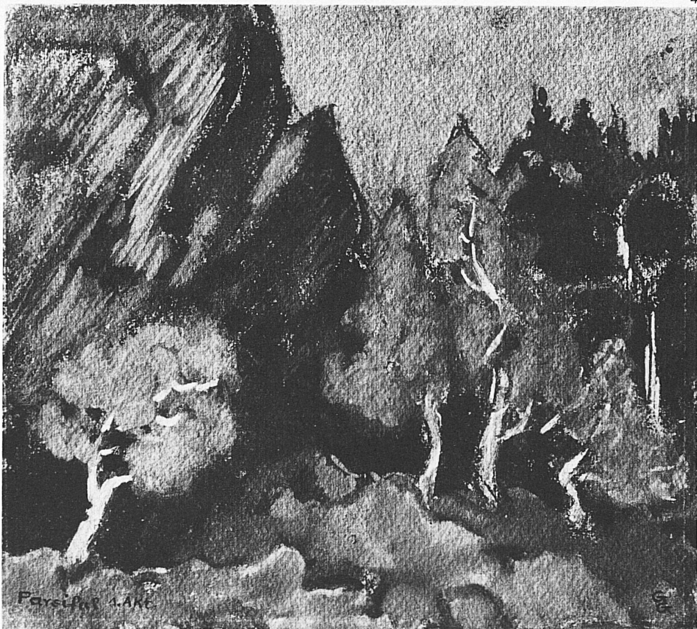
1  2  3, 4, 5